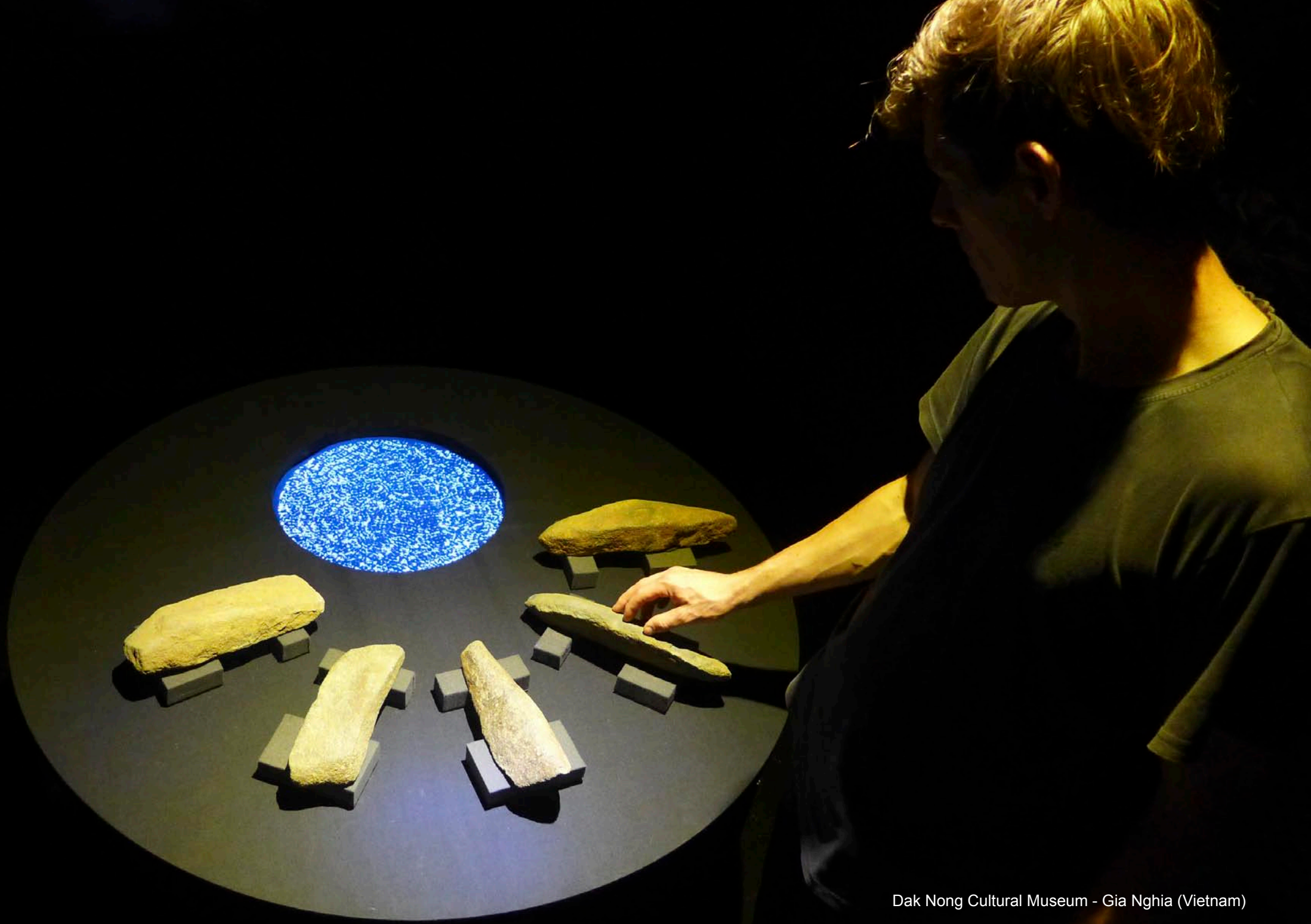
Dak Nong Cultural Museum - Gia Nghia (Vietnam)